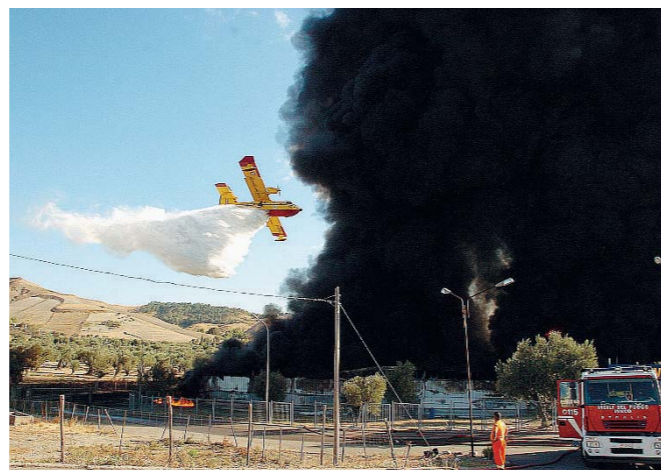
Un Canadair sorvola l'area interessata dall'incendio del 7 settembre