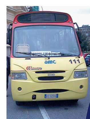
Un autobus dell'Amc