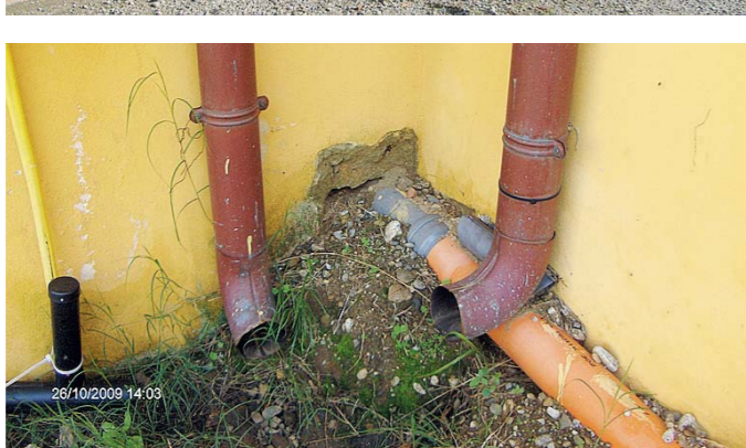
Le immagini dell'edificio degradato, con varchi e fessure da cui entrano i topi