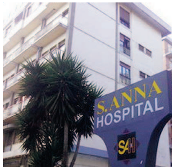
Il Sant'Anna Hospital di Catanzaro

Le cifre riportate dal dottor Bellieni sull'attività di cardiocirurgia del Sant'Anna Hospital parlano di più di 500 interventi da marzo a oggi. Quattro le sale operative a disposizione, due dedicate alla chirurgia vascolare e due prettamente cardiocirchirurgiche; 10 letti di terapia intensiva, 5 di sub semintensiva, due dei quali dotati anche di ventilazione meccanica. La struttura è munita anche di una sala ibrida, una realtà emergente dove il paziente è al centro di una serie di professionalità che insieme affrontano un problema diagnostico o terapeutico.